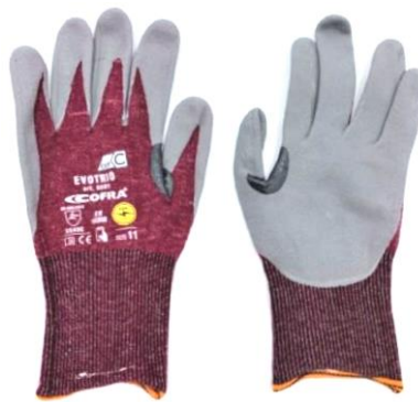
FOTO GUANTO PHOTO OF GLOVE

The PPE type complies with the applicable essential health and safety requirements of Regulation (EU) 2016/425.