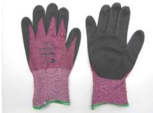
FOTO GUANTO PHOTO OF GLOVE

The PPE type complies with the applicable essential health and safety requirements of Regulation (EU) 2016/425.