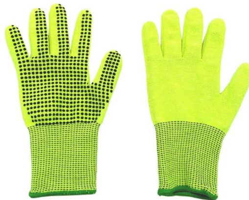
FOTO GUANTO PHOTO OF GLOVE

The PPE type complies with the applicable essential health and safety requirements of Regulation (EU) 2016/425.