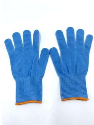
FOTO GUANTO PHOTO OF GLOVE

The PPE type complies with the applicable essential health and safety requirements of Regulation (EU) 2016/425.