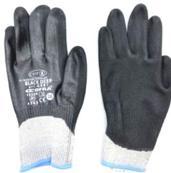
FOTO GUANTO PHOTO OF GLOVE

The PPE type complies with the applicable essential health and safety requirements of Regulation (EU) 2016/425.